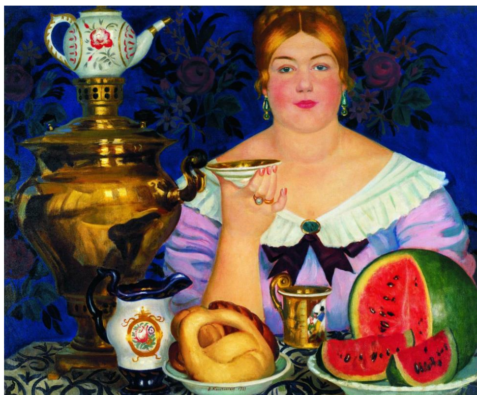
16. Кустодиев Б.М. Купчиха. Холст. Масло. 1923 год.