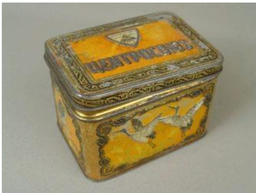
8. Коробка для чая. Чайница. Начало XX века. Россия.