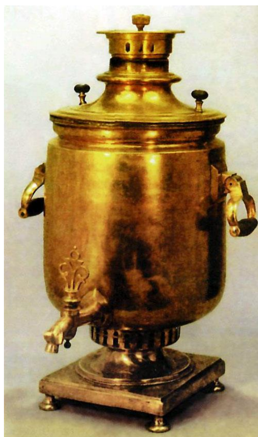
9. Самовар трактирный. Конец XIX века – начало XX века. Москва. Фабрика Сафонова.