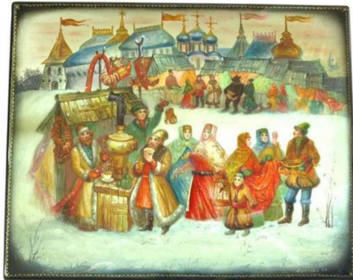
24.Фролова Т.В. Тульские напевы. Коробочка. Федоскино. XX век.