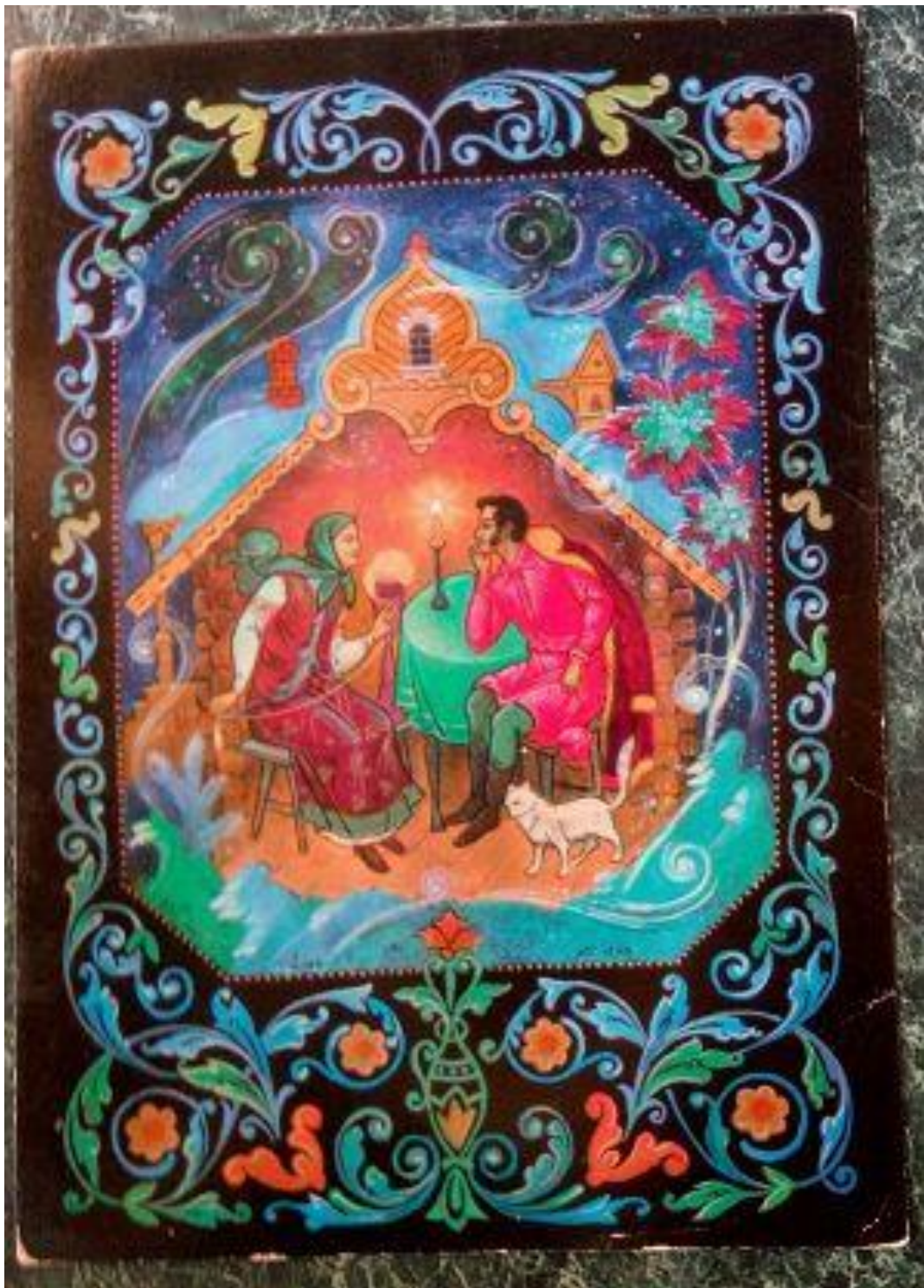
2. Бокарев К.С. У няни. Баул. Палех. 1975 год.