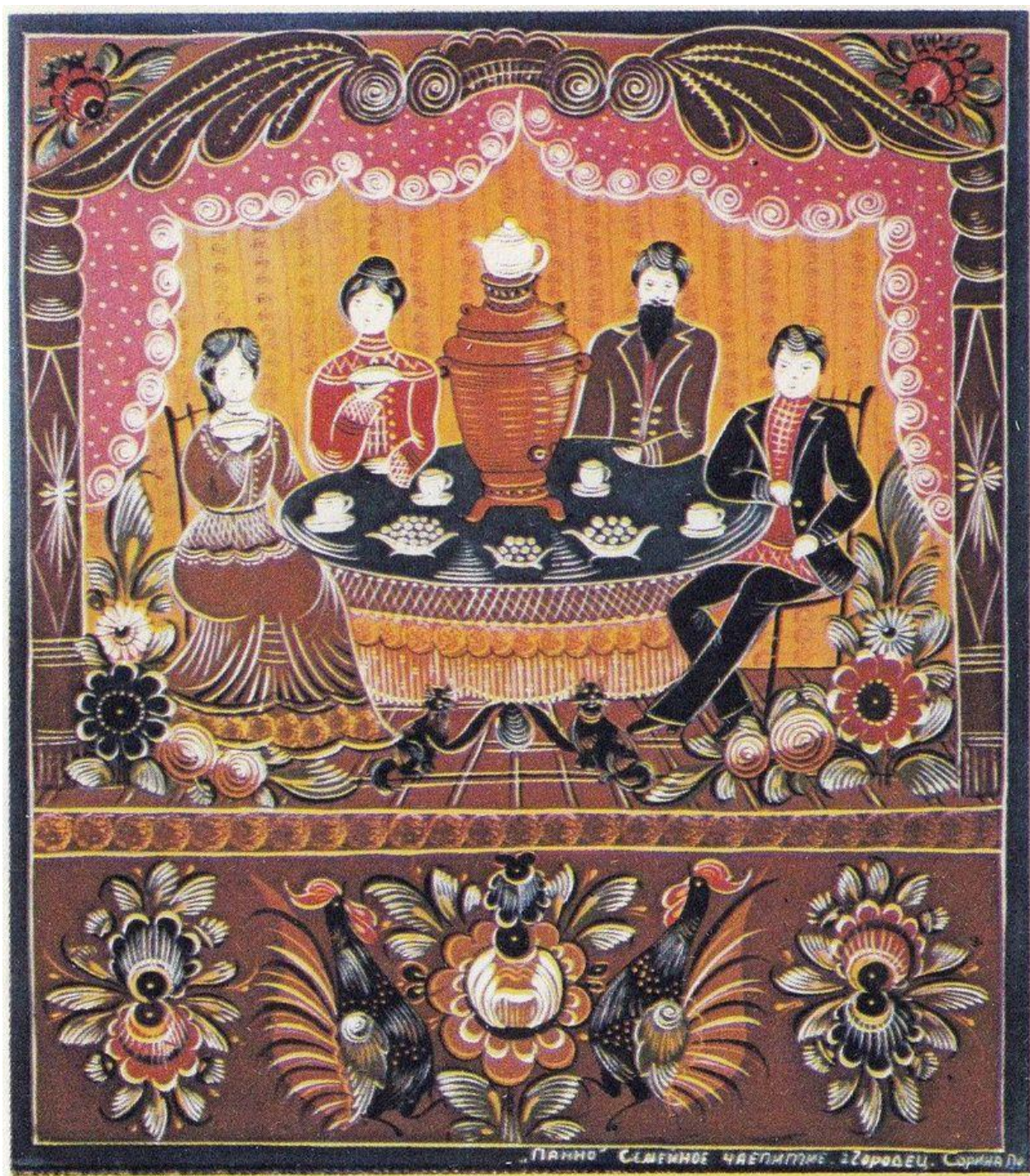
21.Сорина П. Великое чаепитие. Городецкая роспись. XIX век.