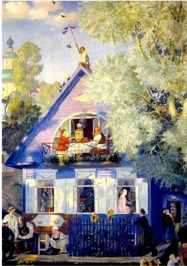
Голубой домик Б. Кустодиев