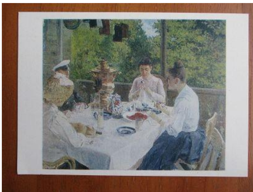
13. Волосков А.Я. За чайным столом. Холст. Масло. 1857 год.