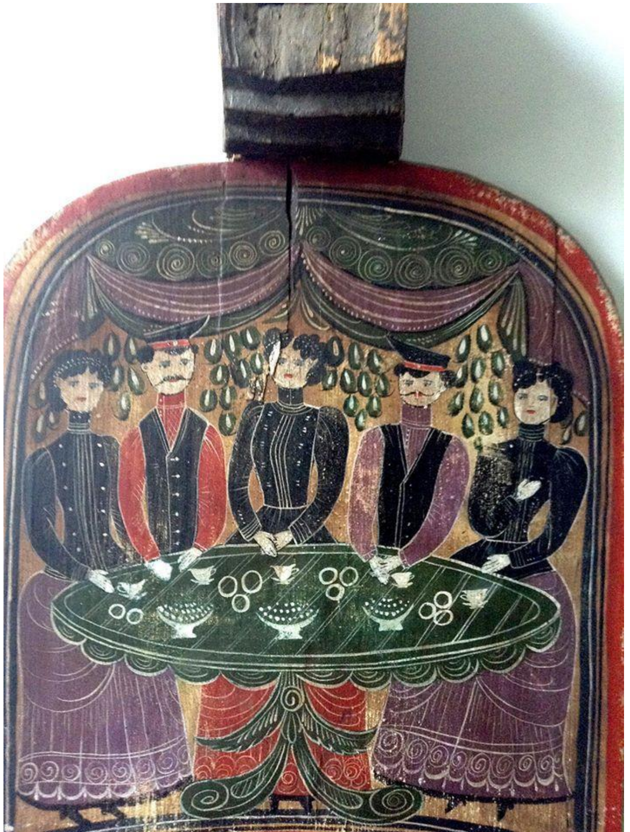
22.Прялка со сценой чаепития. Городецкая роспись. 1865 год.