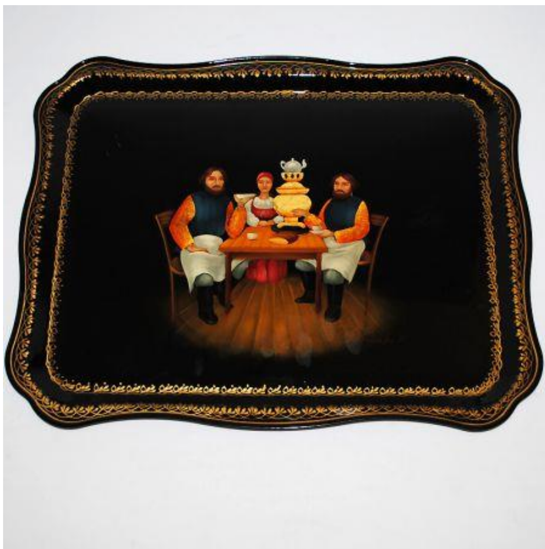
25. Поднос со сценой чаепития. Жостова. 1970-е годы.