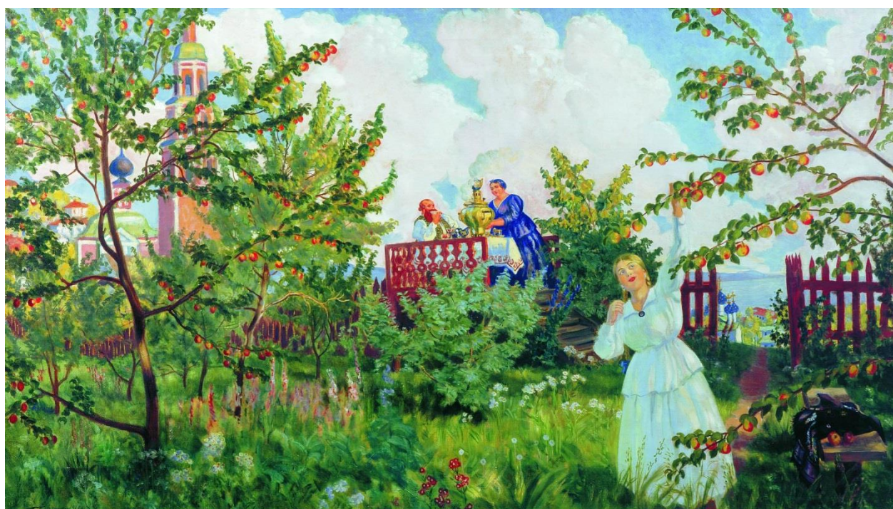
14. Кустодиев Б.М. Яблоневый сад. Холст. Масло. 1920-е годы.