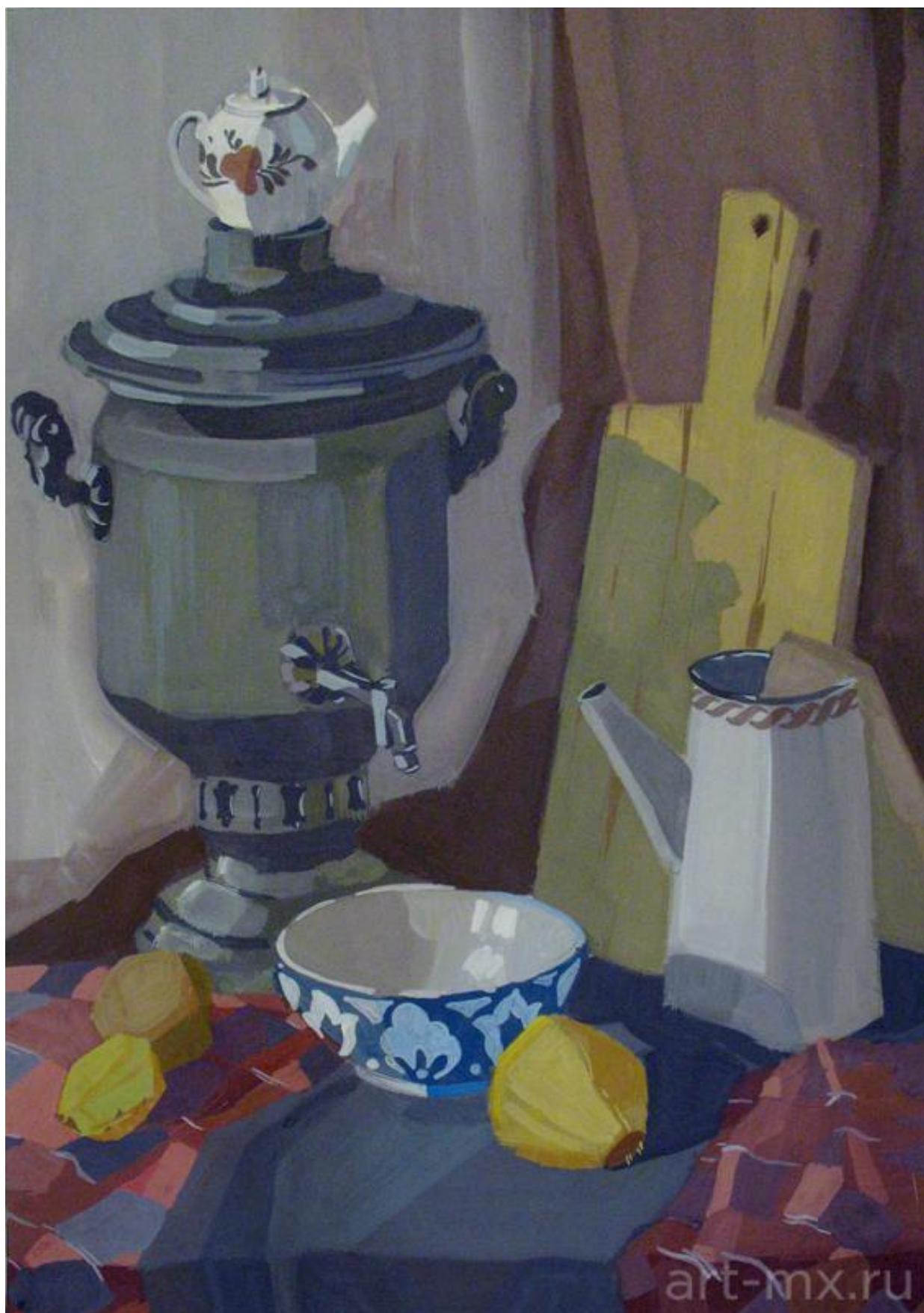
20. Неизвестный художник. Самовар. Натюрморт.