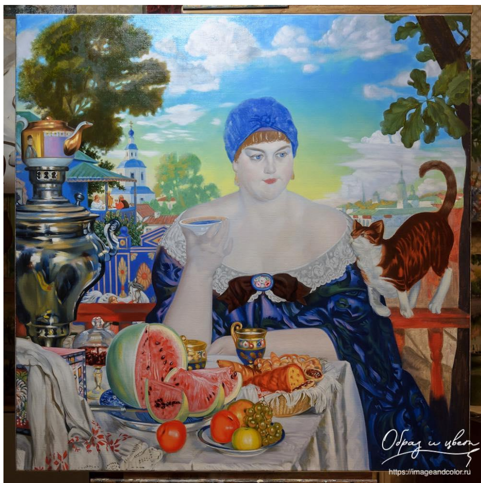
15. Кустодиев Б.М. Купчиха за чаем. Холст. Масло. 1918 год.