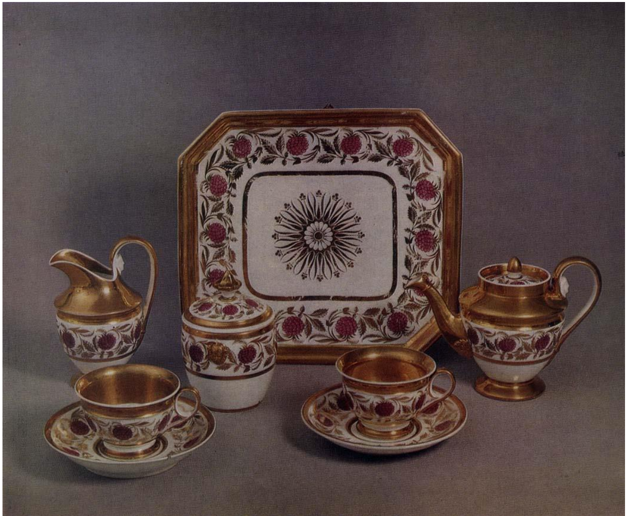
5. Предметы для чайного стола. Вторая половина XIX века. Россия.