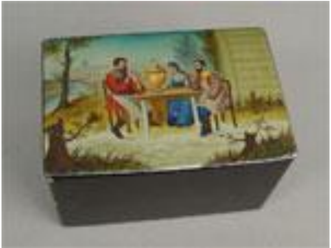
17. Чаепитие. Роспись на крышке шкатулки. Вторая половина XIX века. Москва. Мастерская Вишнякова.