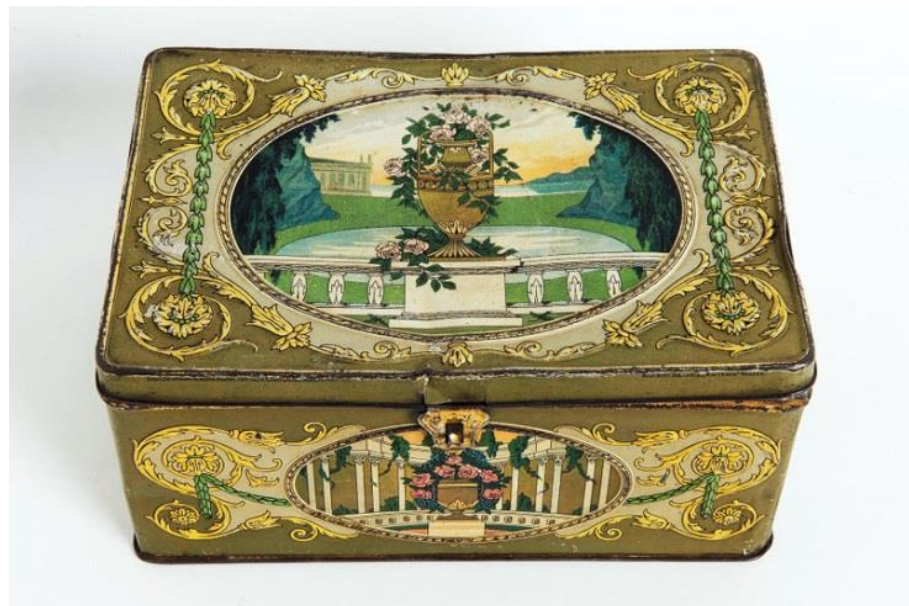
7. Дорожный погребец для чаепития. Конец XIX века – начало XX века.