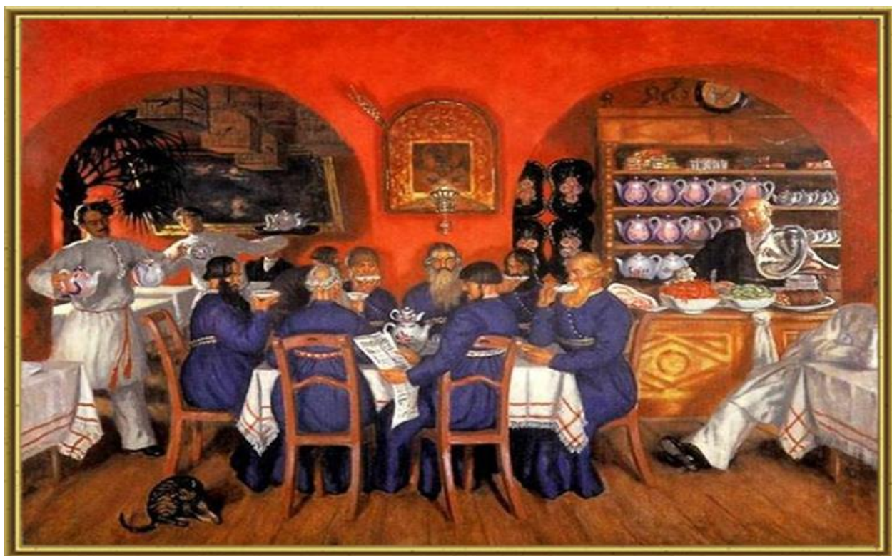
19.Кустодиев Б.М. Московский трактир. Холст. Масло. 1916 год.