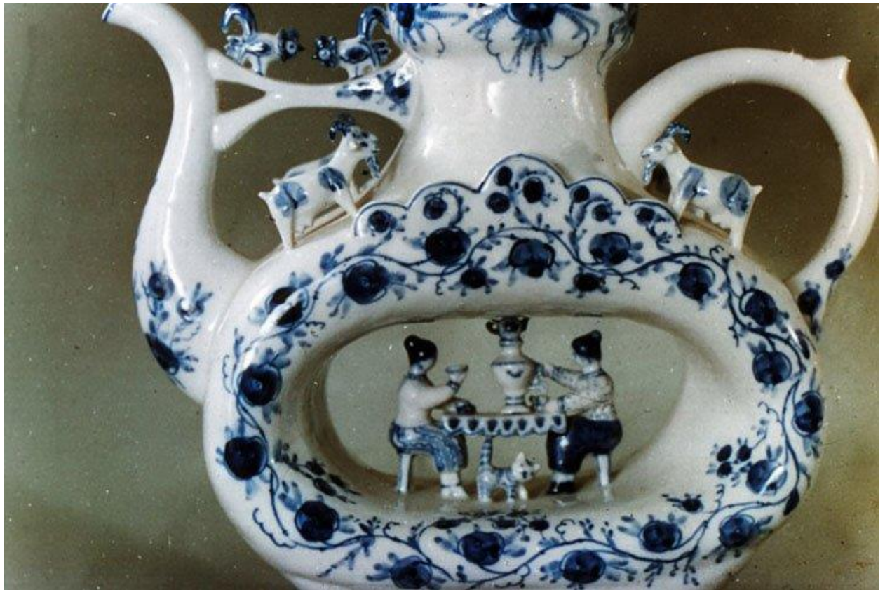
23.Азарова Л. Чаепитие. Керамика. Гжель. XX век.