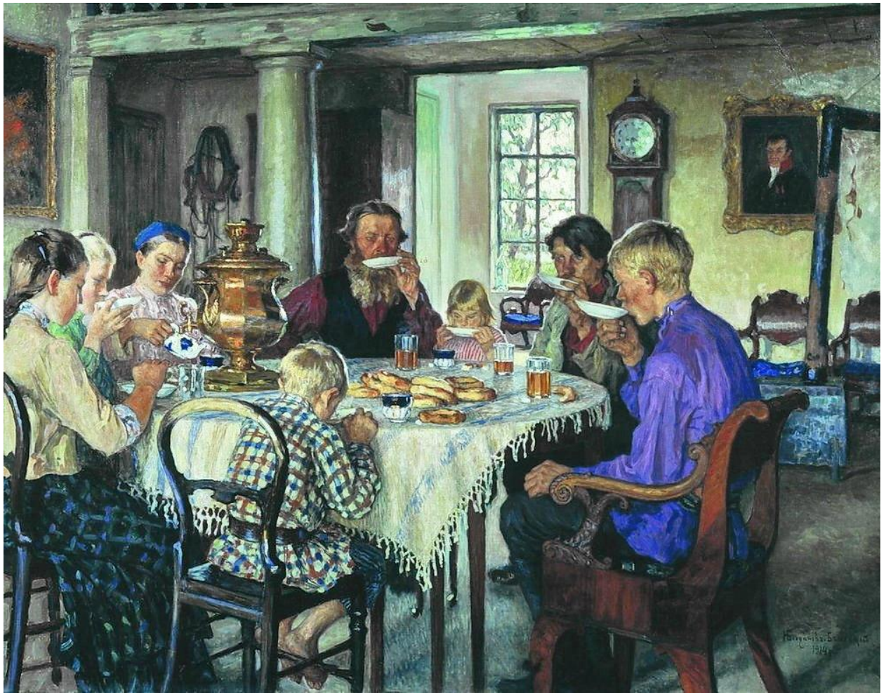
3. Богданов – Бельский Н. Новые хозяева. Русское чаепитие. Холст. Масло. 1913 год