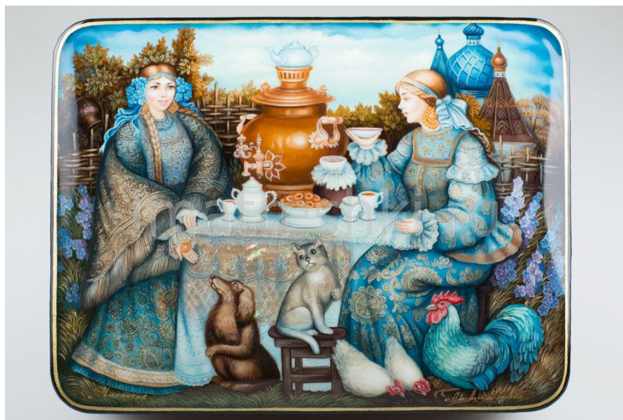
12. Козлов С.И. Чаепитие. Роспись на шкатулке. Федоскино. 1978 год.