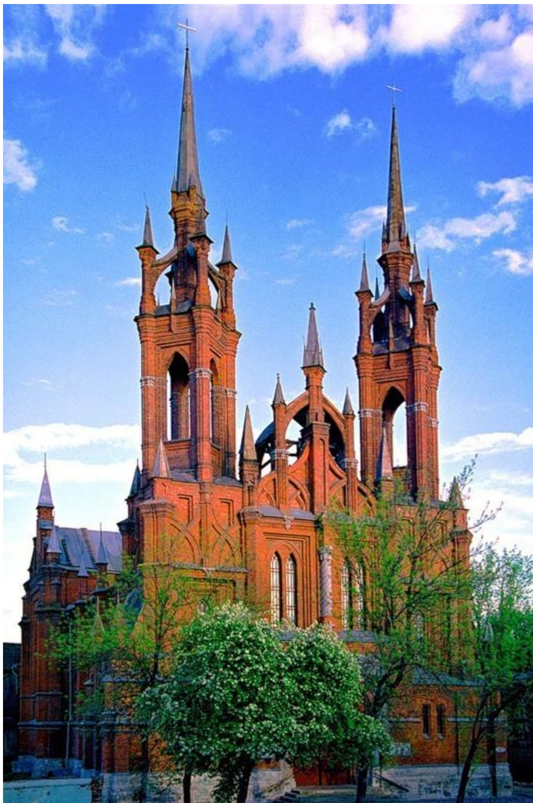
Католический храм Пресвятого Сердца Иисуса, г. Самара