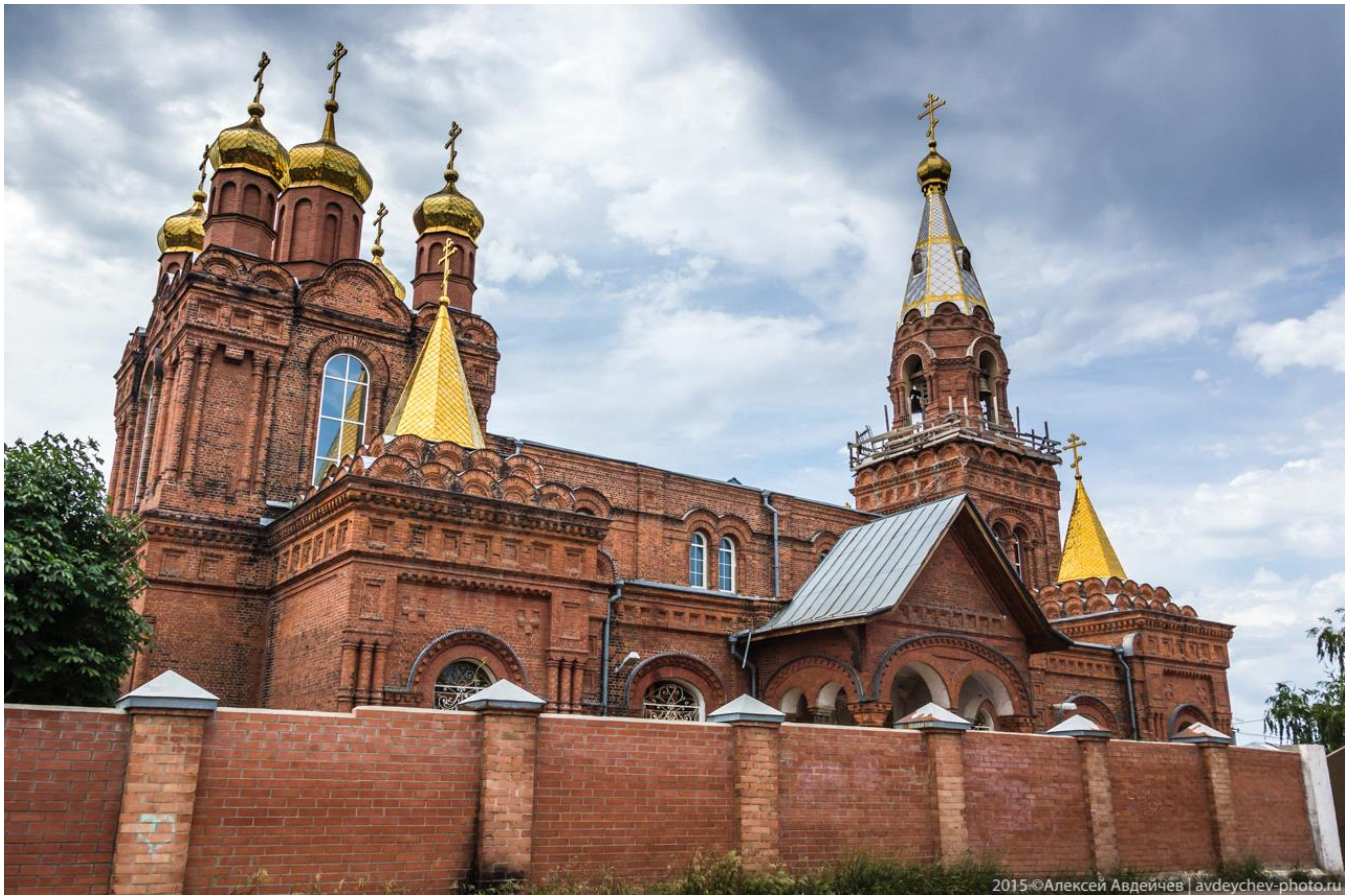
Храм во имя Архистратига Божия Михаила. Г. Самара.