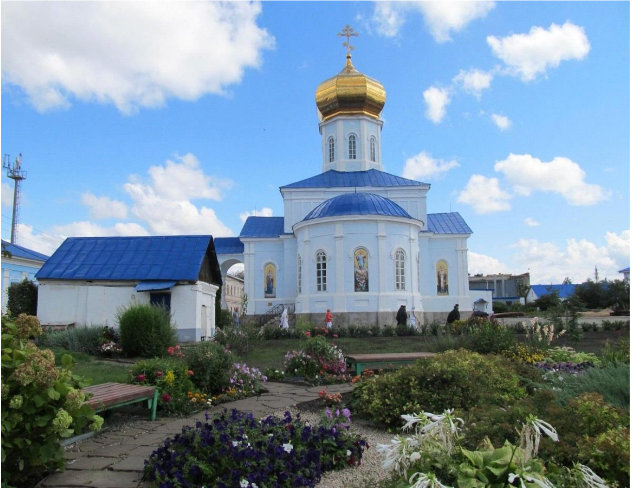
Вознесенский мужской монастырь, г. Сызрань.