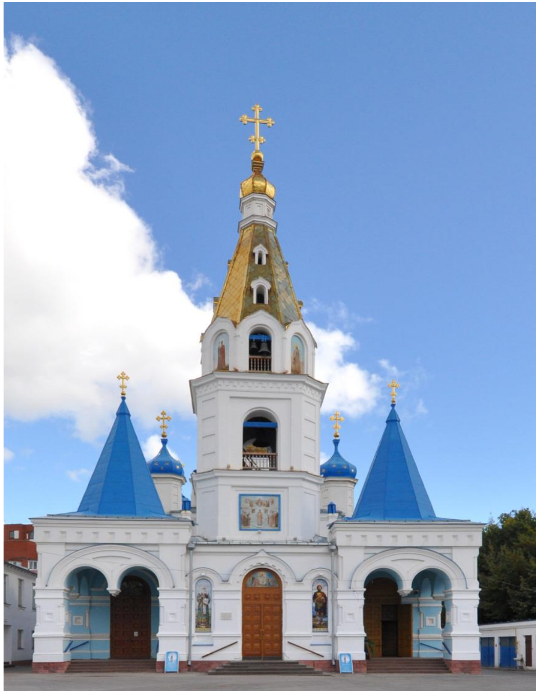
Кафедральный собор в честь Покрова Божьей Матери, г. Самара