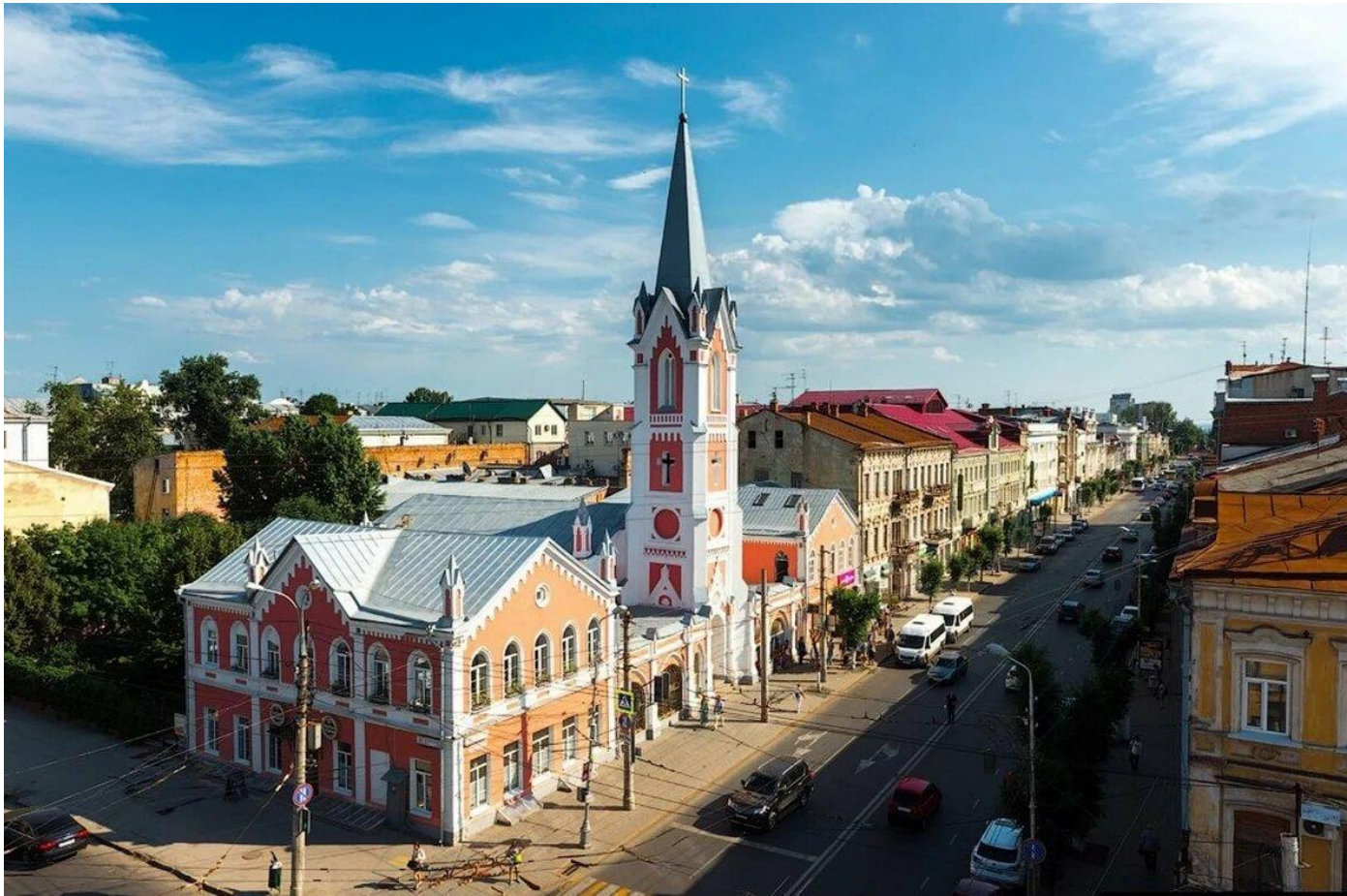
Лютеранская кирха, г. Самара