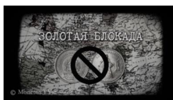
Рис. 15 «Золотая блокада» СССР