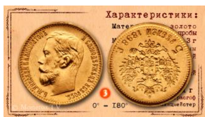
Рис.14 Разновидность с разворотом реверса по отношению к аверсу на 180 градусов.