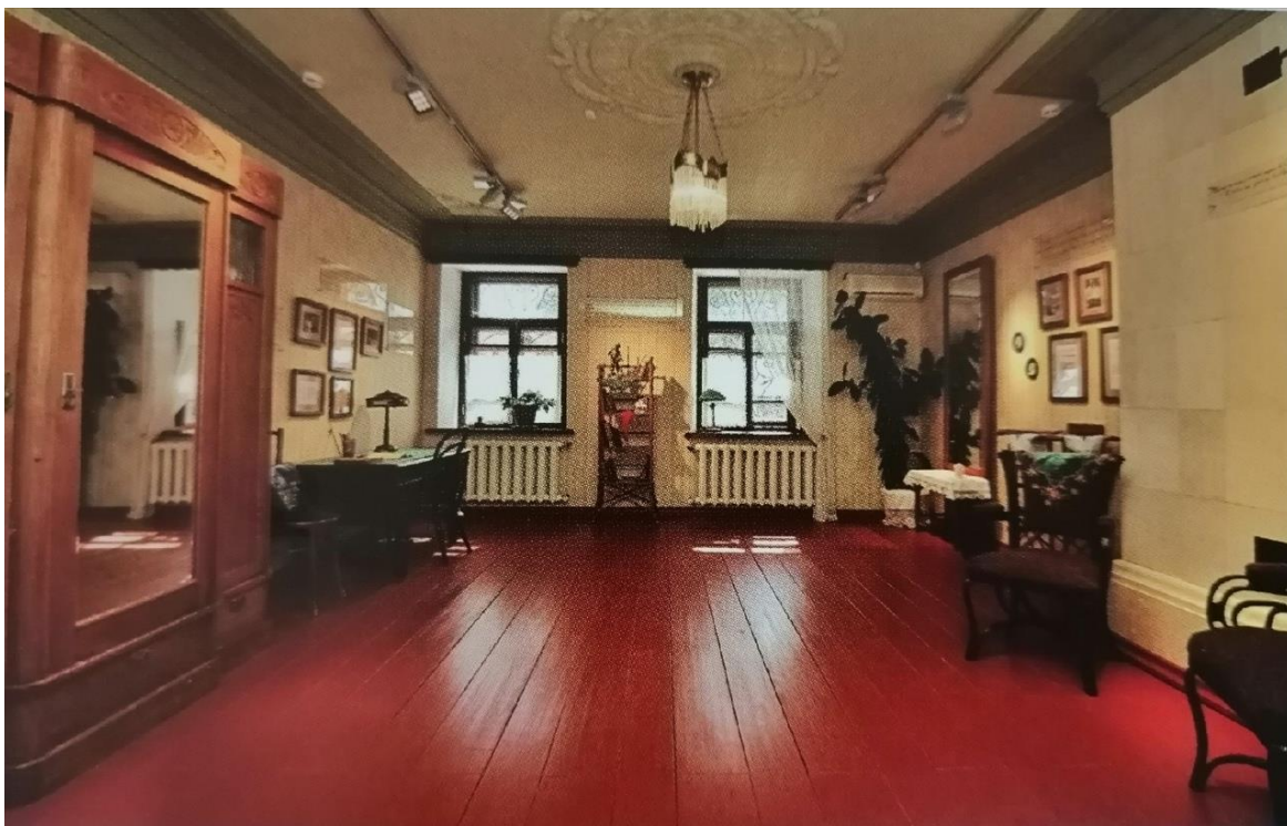
Зал «В гостях у Рязанова».