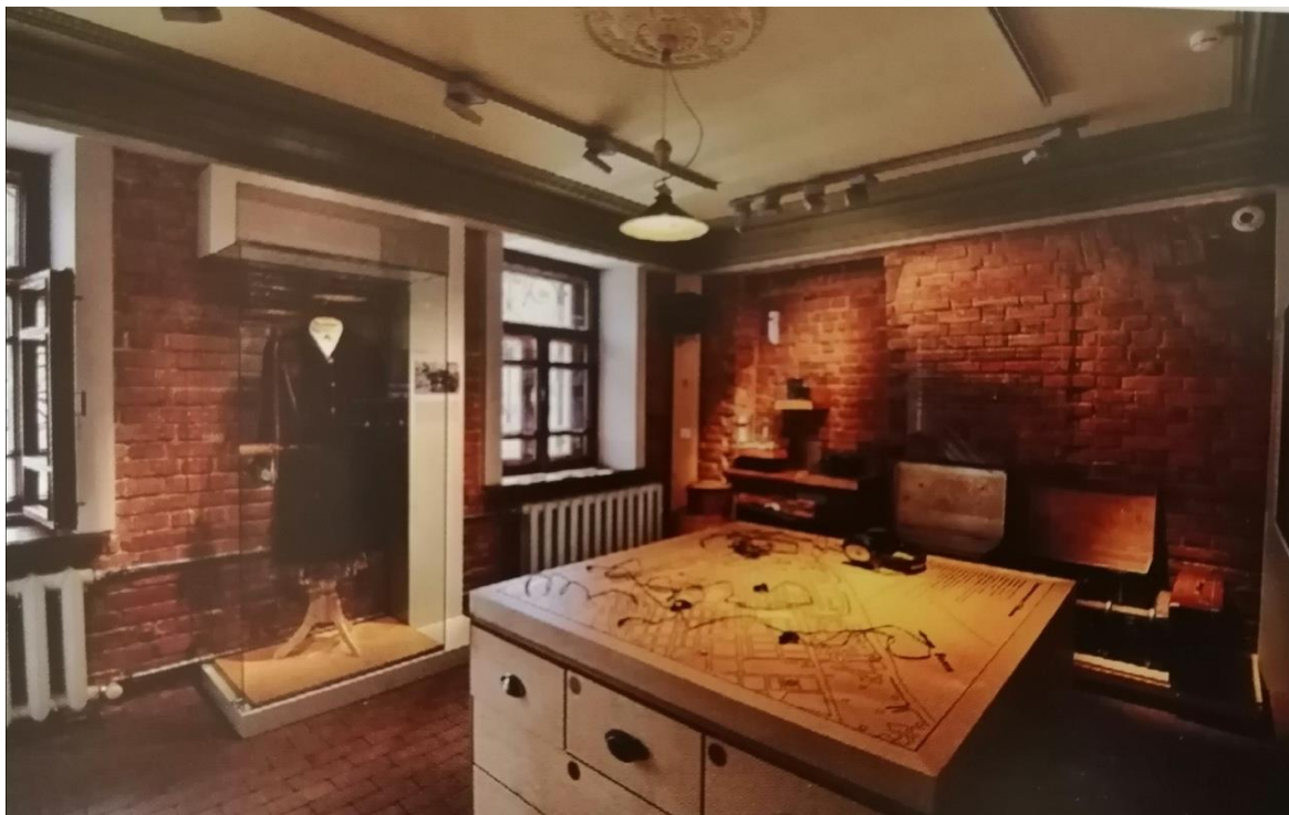
Мемориальная комната семьи Рязанова.