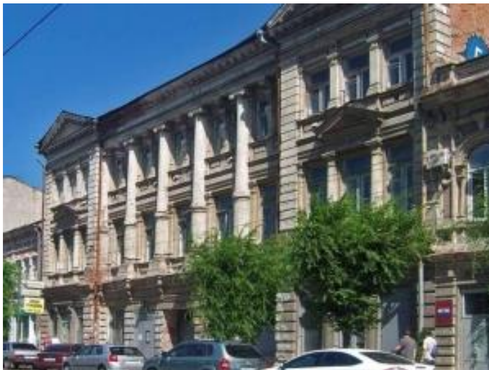
Школа№15 со стороны улицы Куйбышева