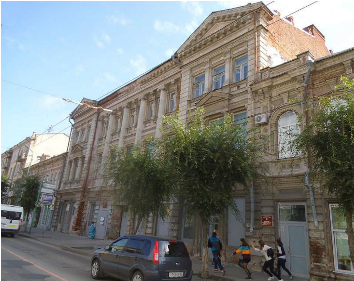
Школа15 - Дом Поплавского в наше время