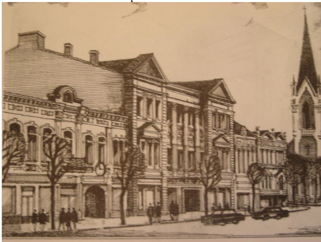
Здание школы №15 советский период