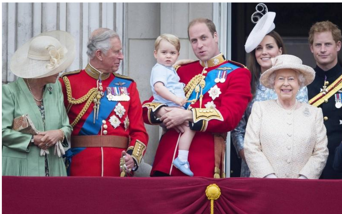
Чарльз, принц Уэльский и его вторая жена Камилла, герцогиня Корнуольская, принц Уильям, герцог Кембриджский и его жена Кэтрин, герцогиня Кембриджская, их сын принц Джордж Кембриджский, Ее Величество Королева Елизавета II и принц Генри Уэльский.