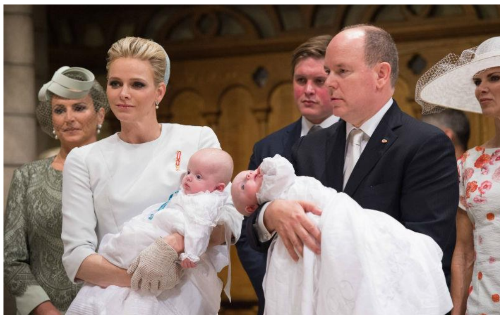
Крещение долгожданных близнецов Жака Оноре Ренье и Габриэллы Терезы Марии.