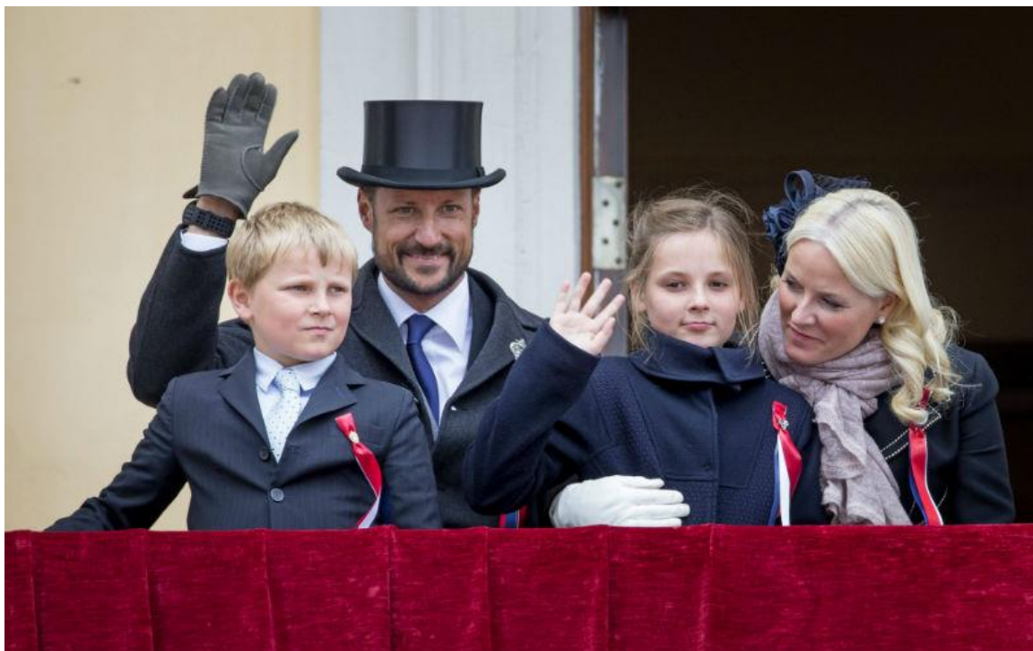
Наследный принц Норвегии Хокон с супругой Метте-Марит и двумя детьми - принцессой Ингрид Александрой и принцем Сверре Магнусом