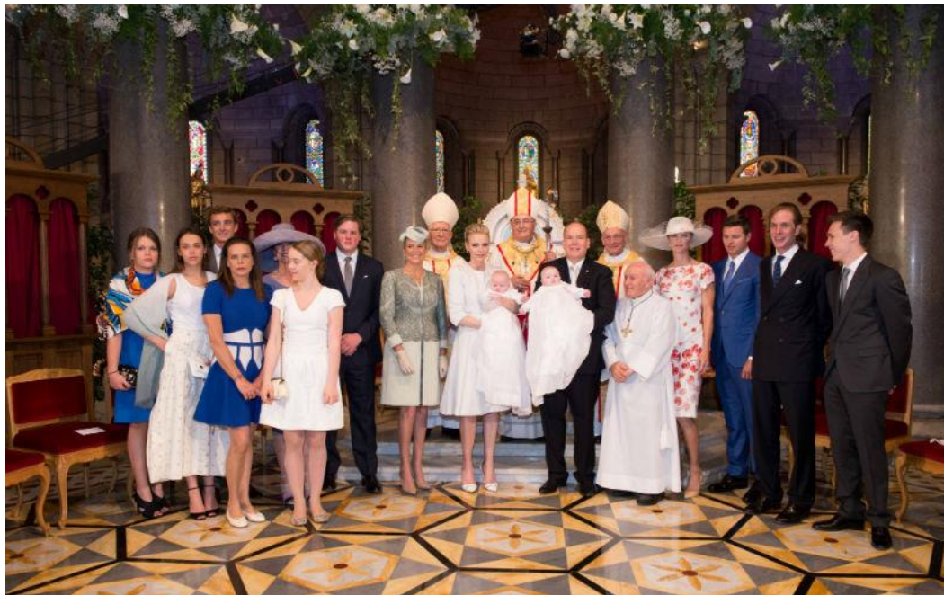
Альбер Александр Луи Пьер Гримальди – правящий князь Монако и герцог Валентинуа, его жена княгиня Монако Шарлен Линетт Уиттсток на церемонии крещения детей Жака Оноре Ренье и Габриэллы Терезы Марии.