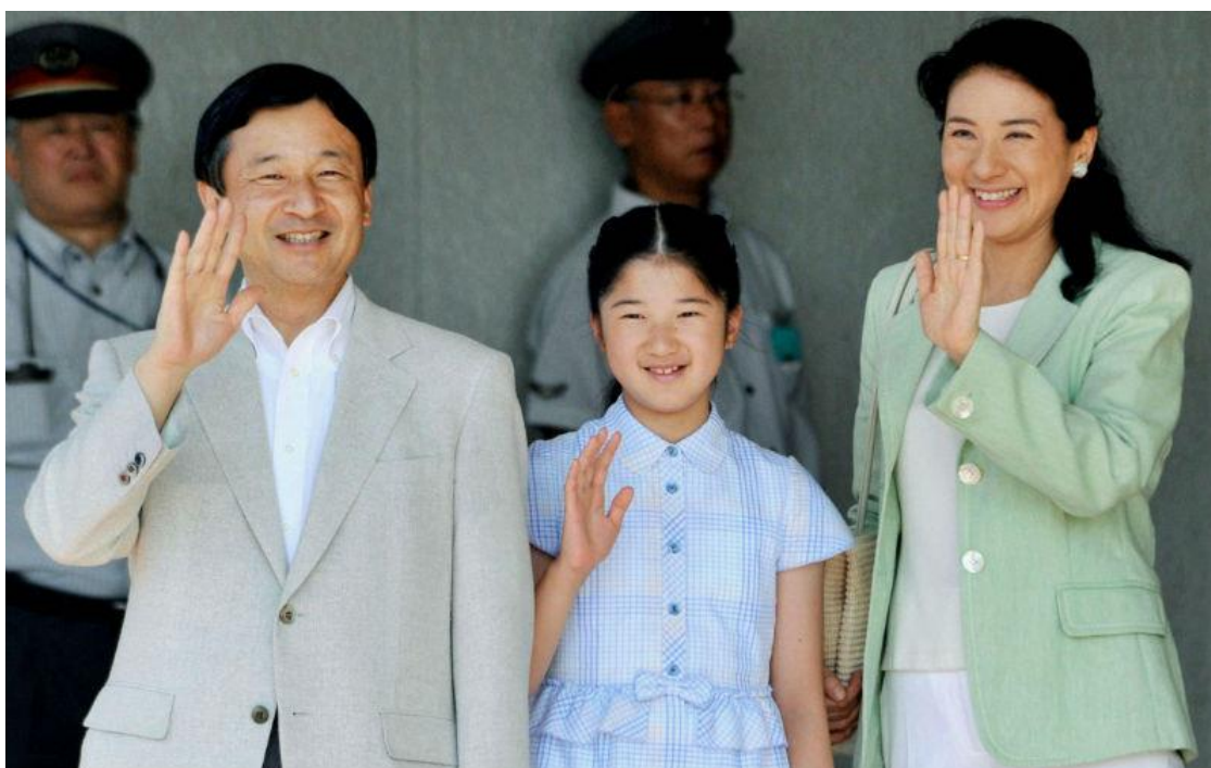
Принцесса Айко с родителями.