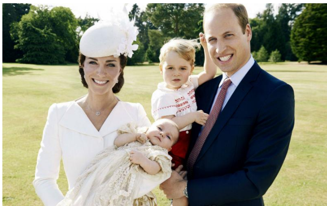
Принцесса Шарлотта с братом принцем Джорджем и родителями.