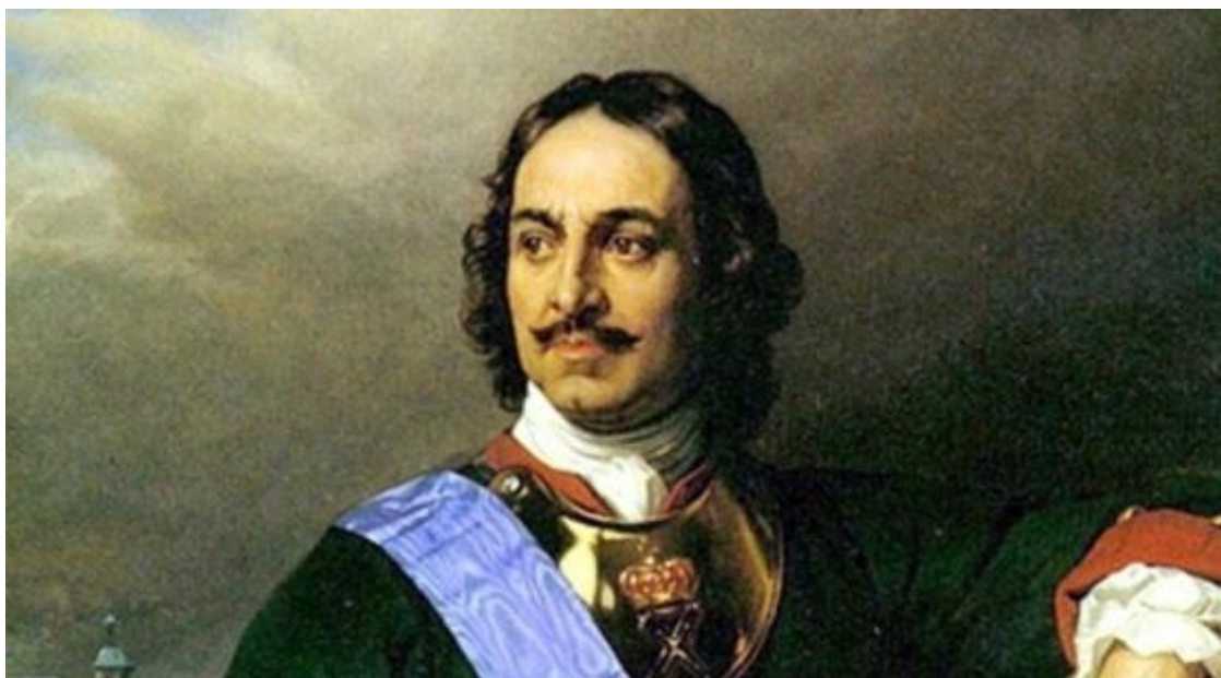
Петр I Алексеевич, прозванный Великий, первый Император Всероссийский.