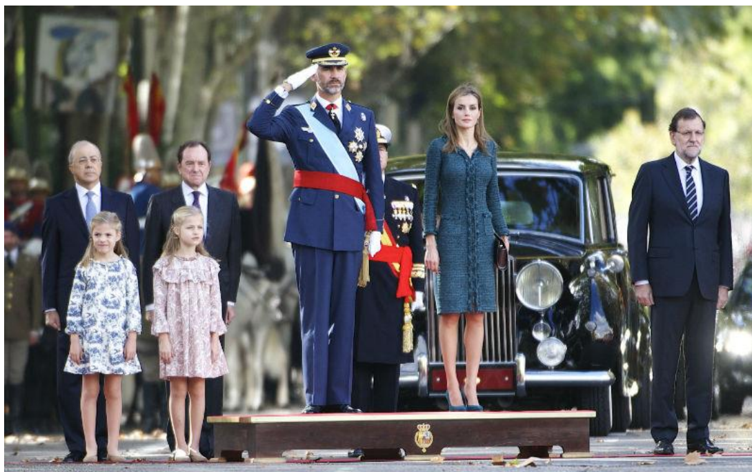
Король Испании Филипп VI и королева Летисия с дочерьми.