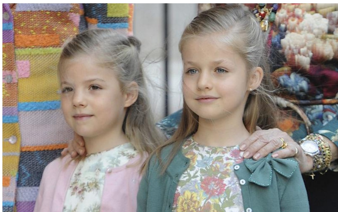
Инфанта София и инфанта Леонор.