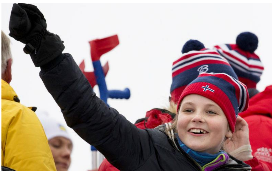
Принцесса Ингрид болеет за команду из Норвегии на лыжных соревнованиях.