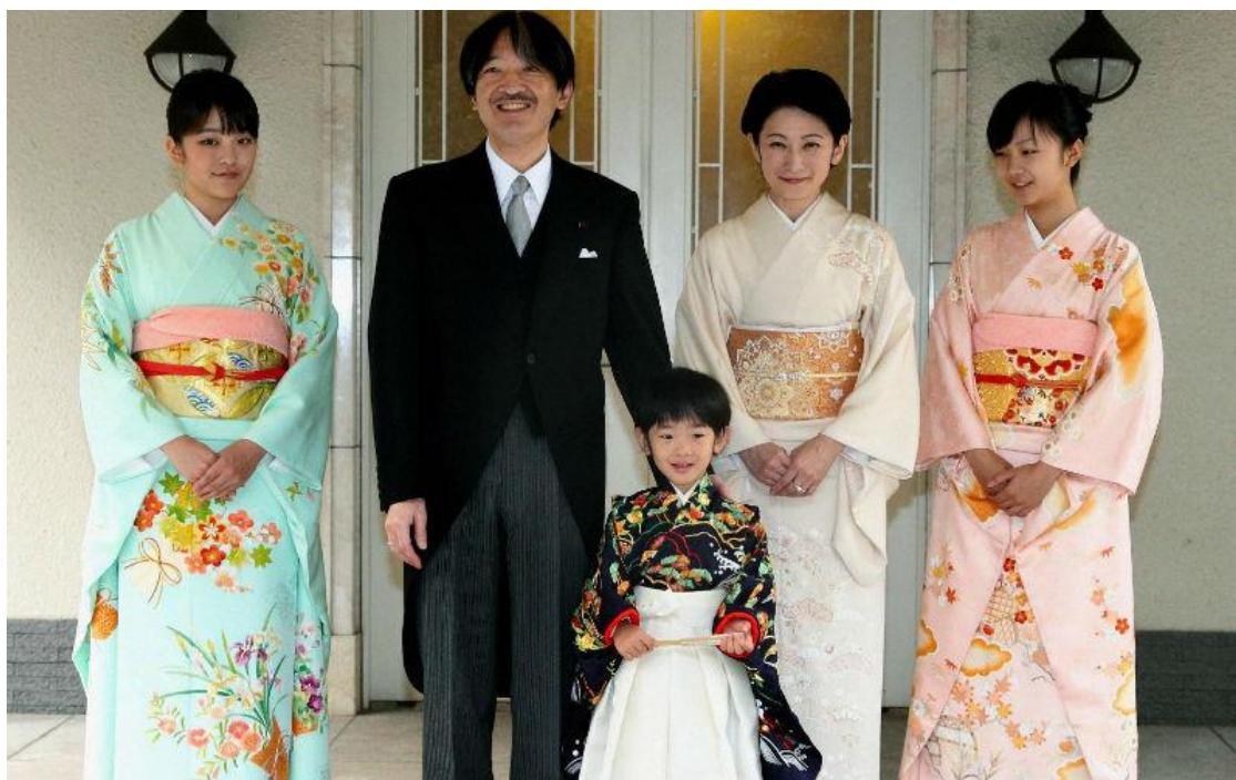
Принц Хисахито с сестрами принцессой Мако и принцессой Како, отцом принцем Акишино (Фумихито) и мамой принцессой Кико.