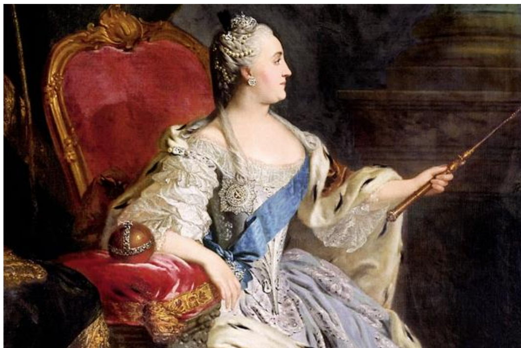
Екатерина II Алексеевна Великая, императрица Всероссийская.