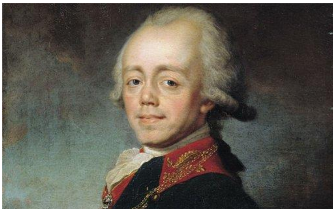
Павел Петрович, Император Всероссийский, великий магистр Мальтийского ордена, сын Петра III Федоровича и Екатерины II Алексеевны