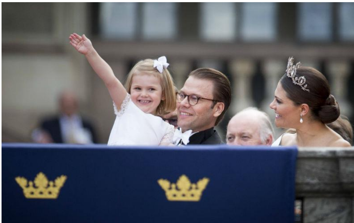
Принцесса Швеции, герцогиня Эстергётландская - дочь наследницы шведского престола кронпринцессы Виктории и ее супруга, герцога Вестергётландского Даниэля Вестлинга