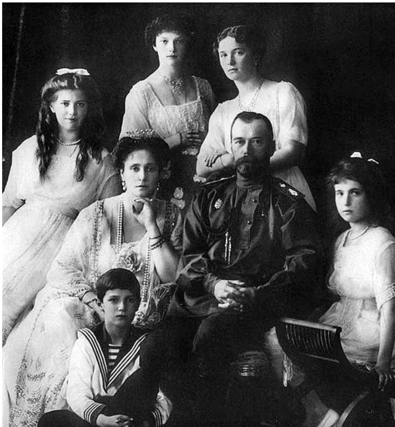
Семья Николая II в 1913 году (слева направо: Мария, Татьяна, Ольга, Александра Федоровна, Николай Александрович, Алексей, Анастасия).