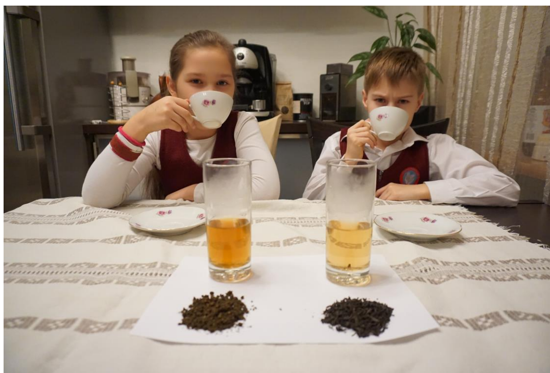
Рис. 2. Пробуем чай после четвертого раза заваривания