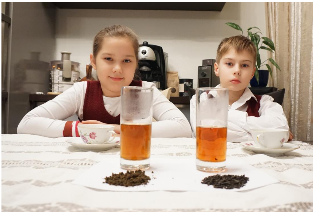
Рис. 1 Заварили первый раз