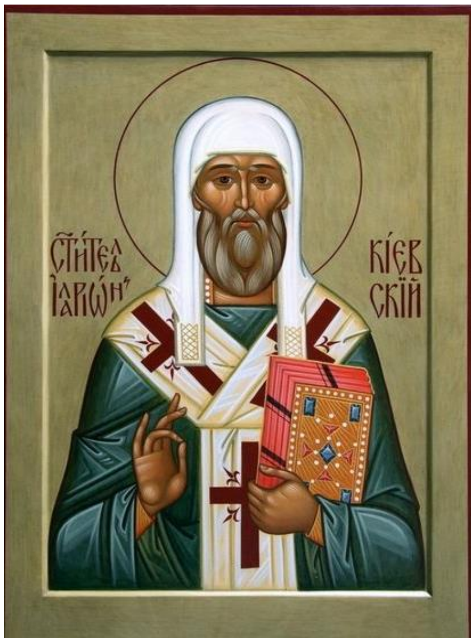
3. Митрополит Иларион Киевский. Икона XXI в.