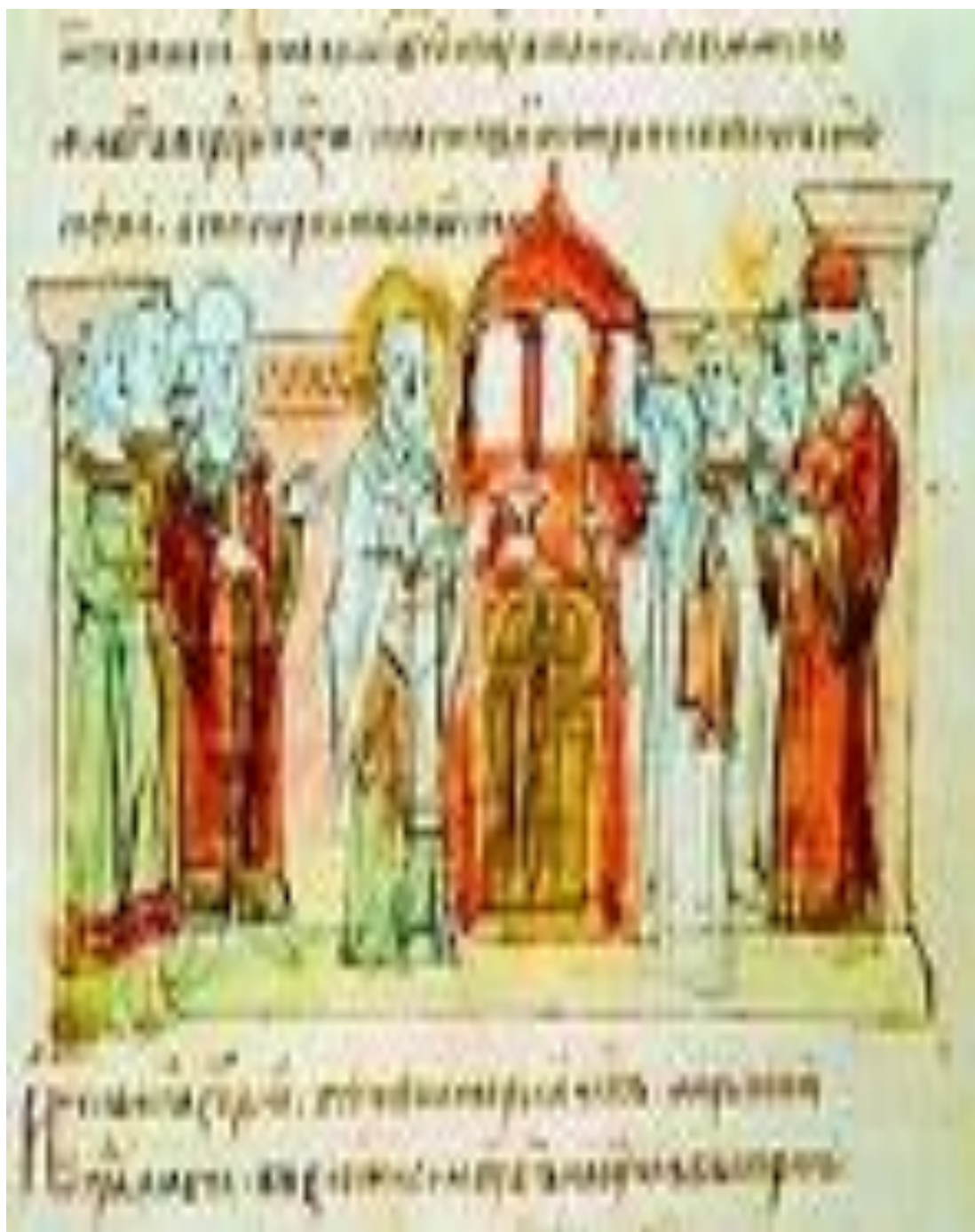
2. Настолование митрополита Илариона . Миниатюра Радзивилловской летописи