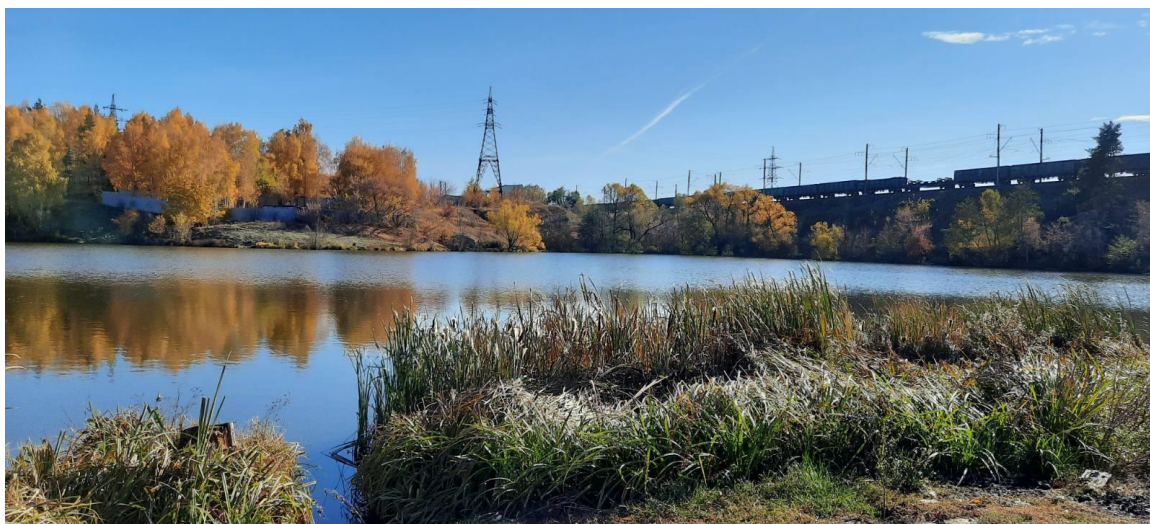
Рисунок 1. Фотография по творческому заданию. Преп. Сергеева Л.А.