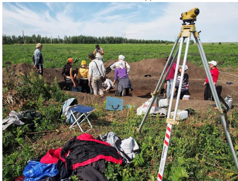
Приложение 2. Археологические находки на месте Муромского городка. 2013-2014 гг.