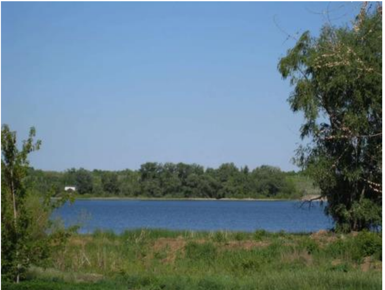
Озеро «Песчаное» с. Черноречье