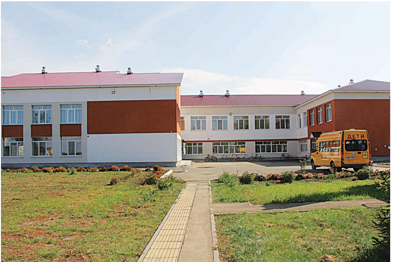
ГБОУ СОШ с. Черноречье