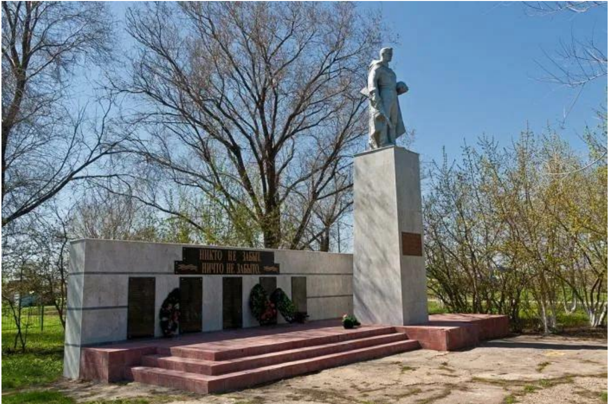
Памятник «Неизвестному солдату»