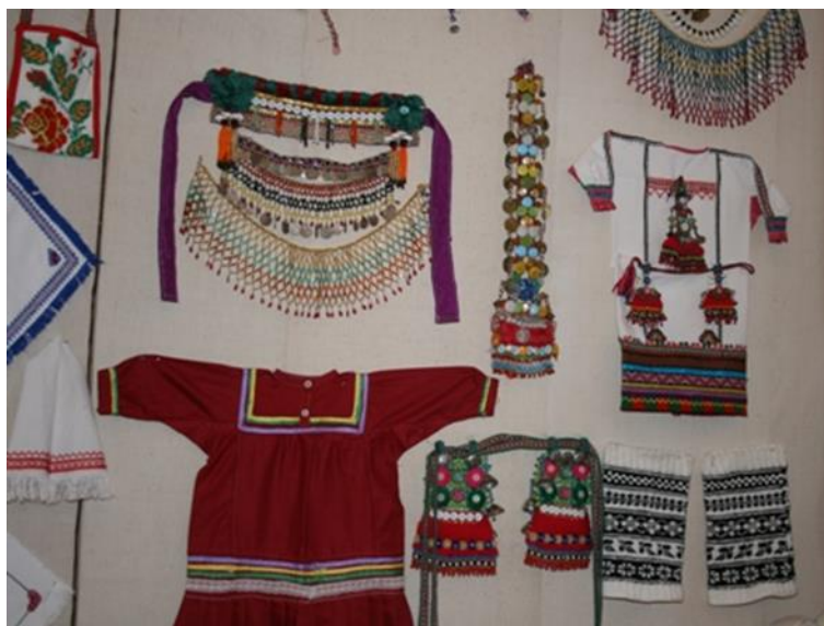
Приложение 4. Мониста на мордовский костюм.