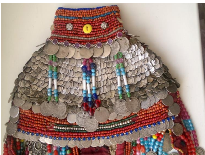
Приложение 5. Чувашский костюм.