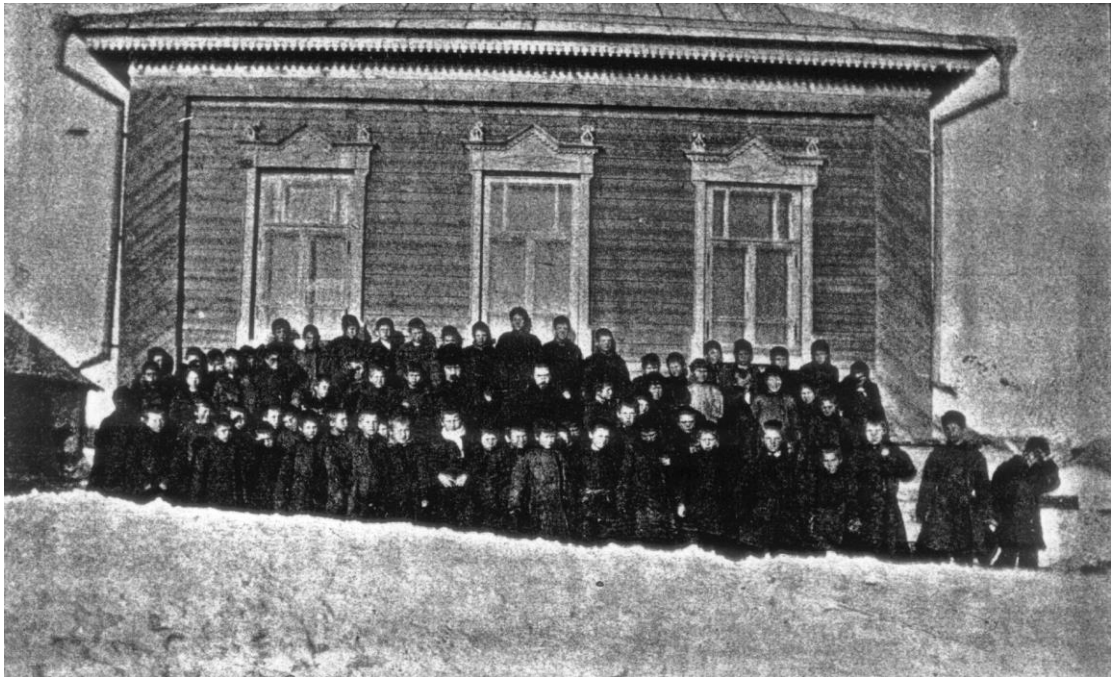
Фото № 2 Снимок 1-й церковноприходской школы села Ивanteeвки Николаевского уезд