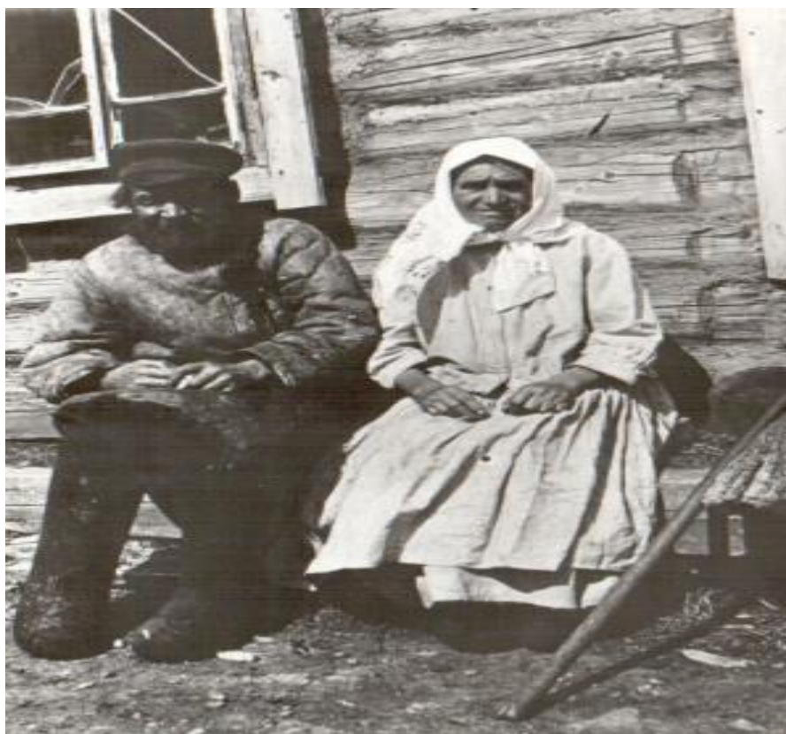
Рис. 2 Алакаевка в 20-е годы 20 века