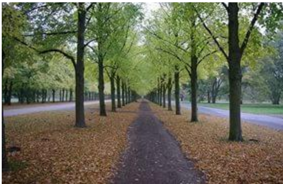
Рис. 4Алакаевка. Липовая аллея.