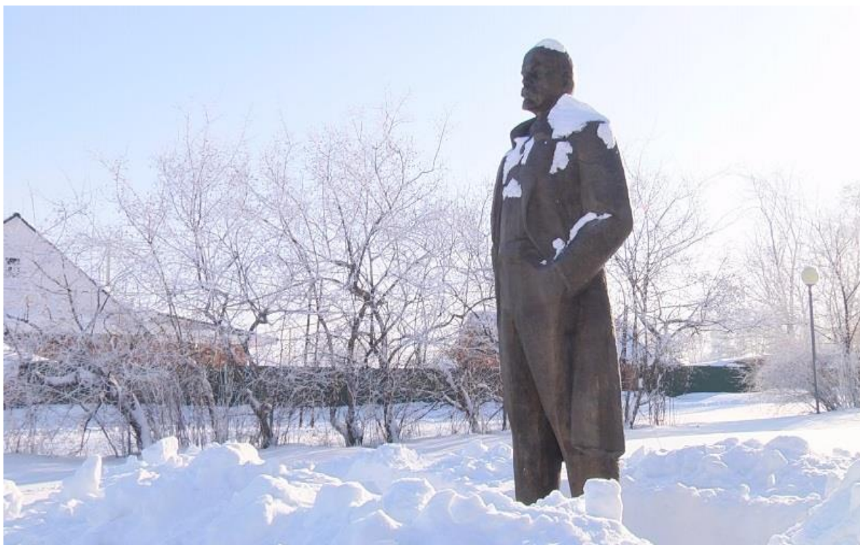
Рис.9 Алакаевка. Памятник Ленину