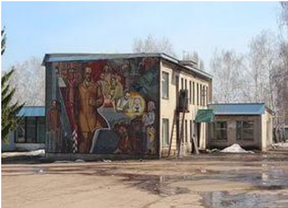
Рис.8 Алакаевка. Мозаичное панно