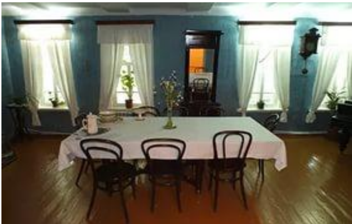
Рис.6 Дом – музей с.Алакаевка. Столовая