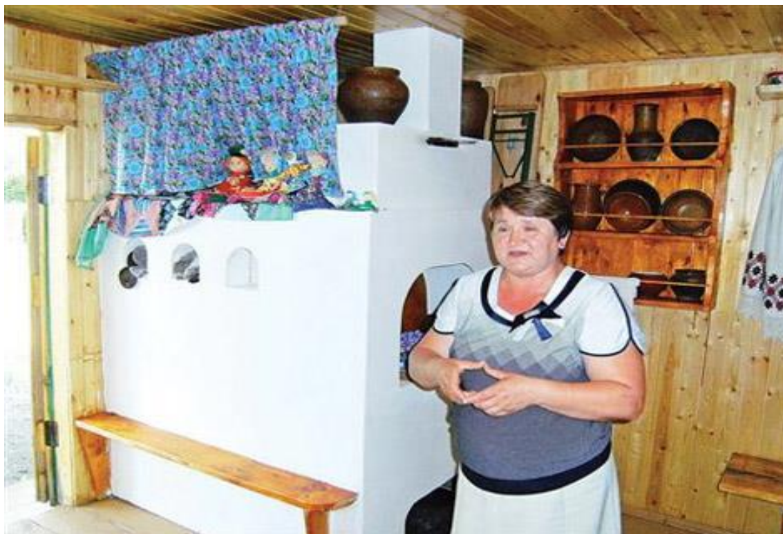
Рис.10 Алакаевка. Традиции русского гостеприимства