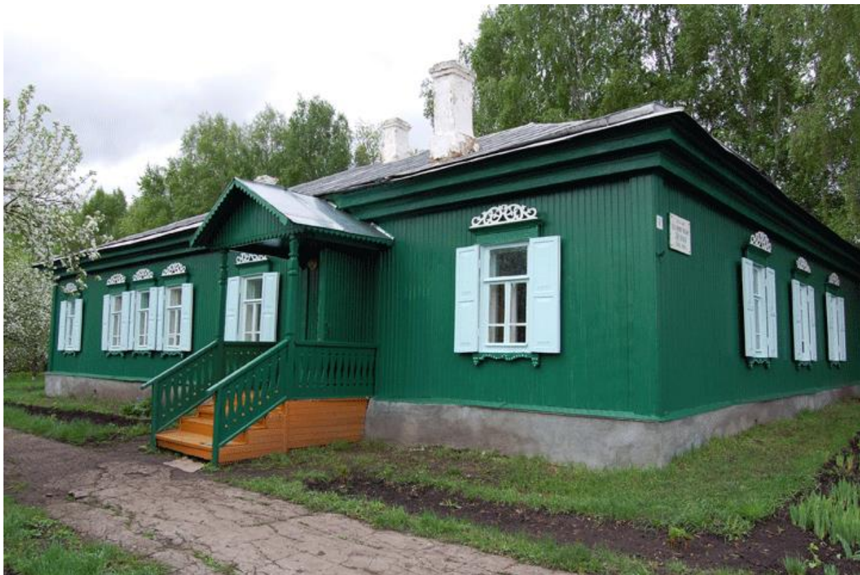
Рис.5 Дом – музей с.Алакаевка