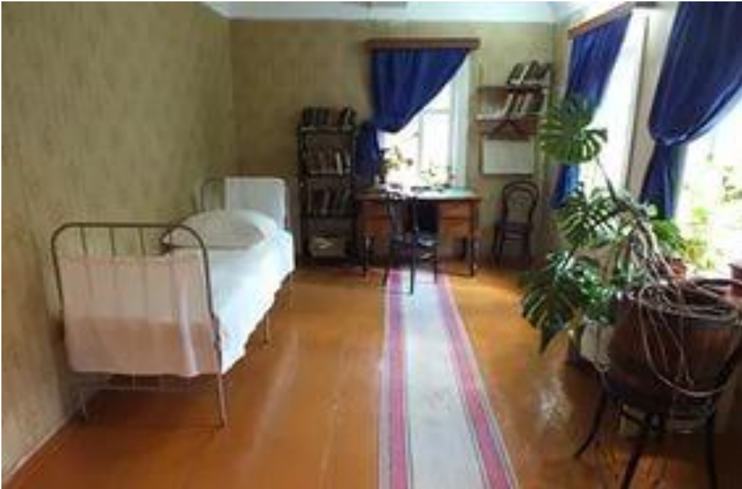
Рис.7 Дом – музей с.Алакаевка. Комната В.И.Ленина