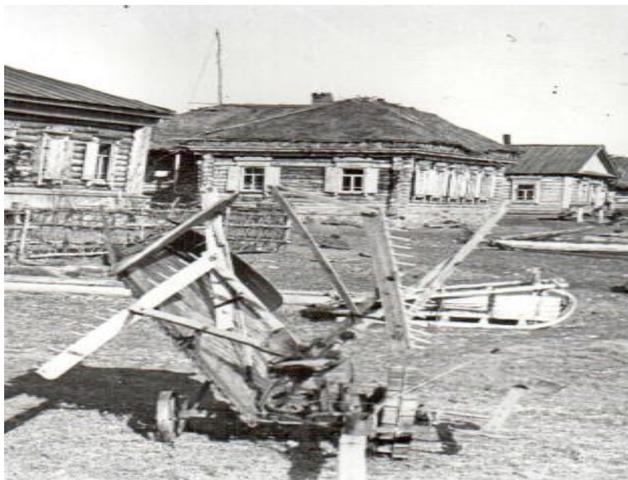
Рис.1 Алакаевка в 20-е годы 20 века