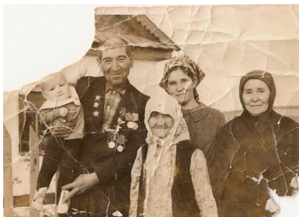
Мой прадед в кругу семьи 1970 год