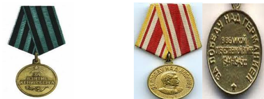
Медали: «За взятие Кенигсберга»