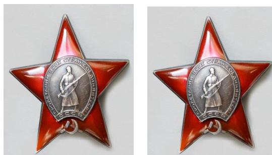
Ордена «Красная звезда»