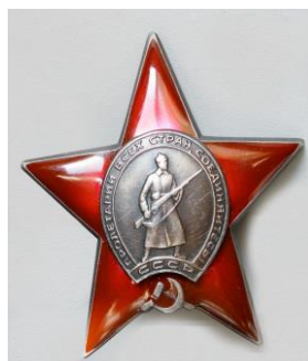
Орден «Красная звезда»