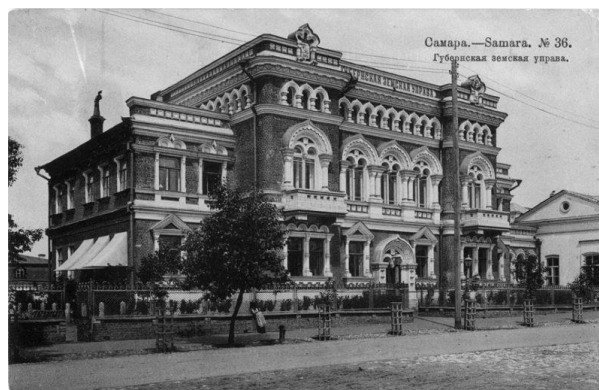
1. Губернская Земская управа