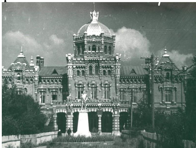
6. Усадьба Самариных