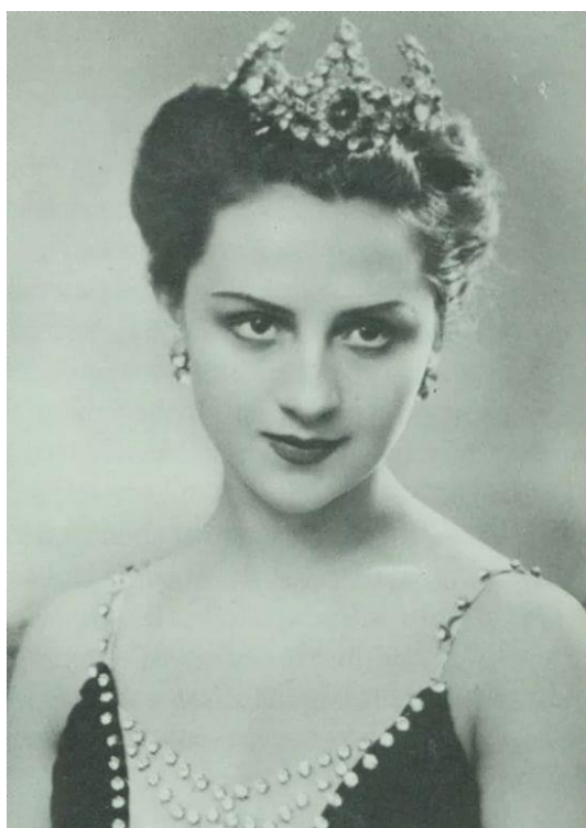
Одиллия "Лебединое озеро"