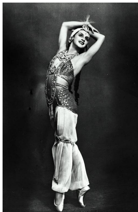
Зарема "Бахчисарайский фонтан"