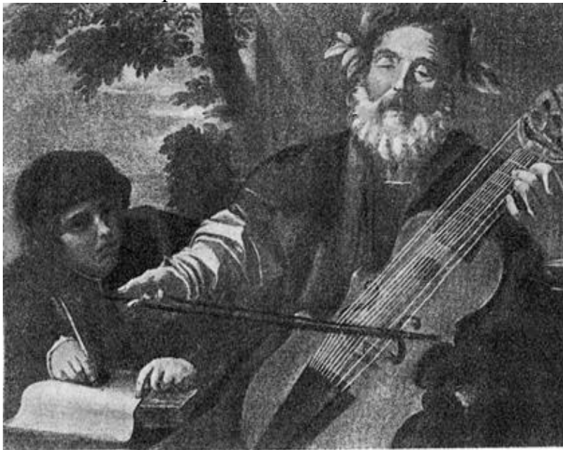
Лира да гамба