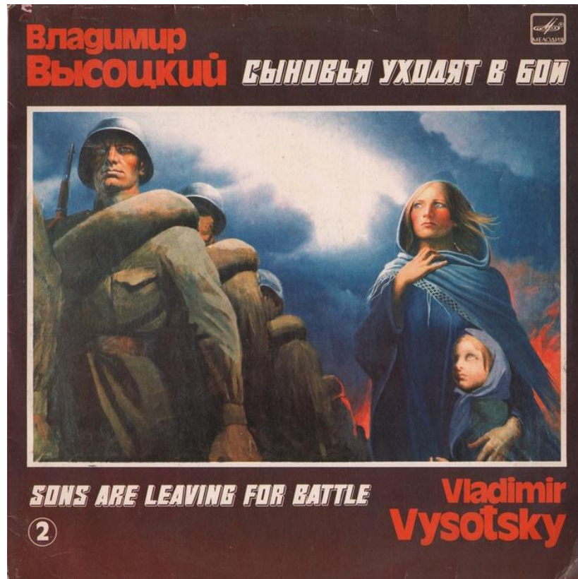
Пластинки с песнями Высоцкого в советское время