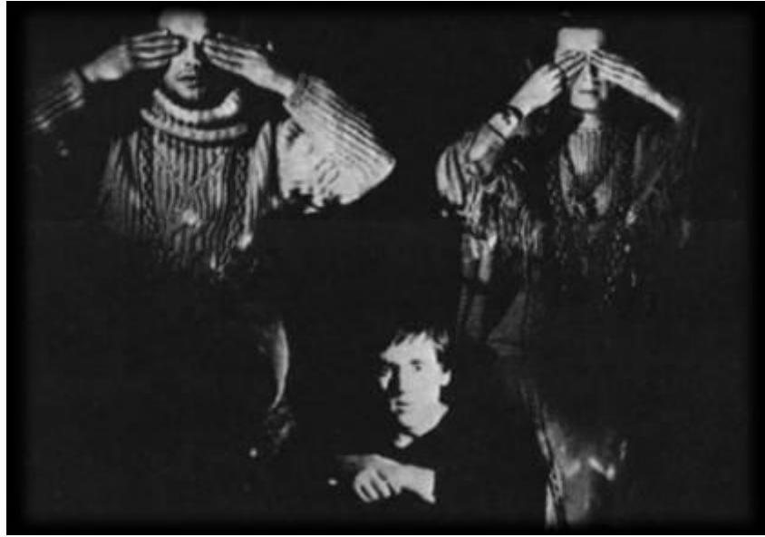
Владимир Высоцкий в роли Гамлета