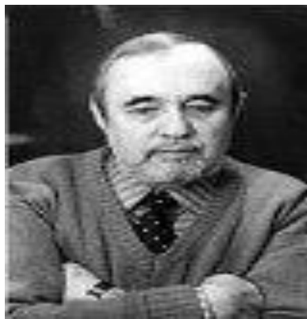
Борис Зиновьевич Сиротин - известный русский поэт.

О величии родной Волги пишет поэт в стихотворении «Поеду до Самары пароходом»: