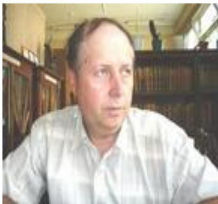
Е. А. Бажанов «Священные реки России».